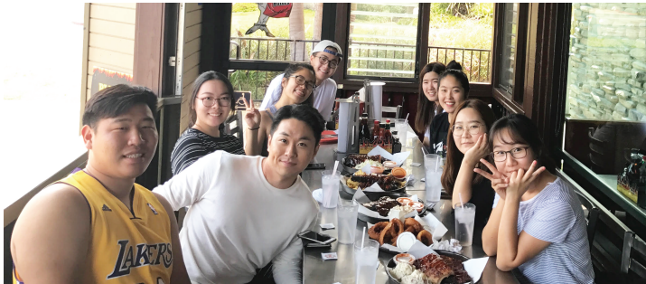
먹을 땐 더 즐거운 EM 학생들!!